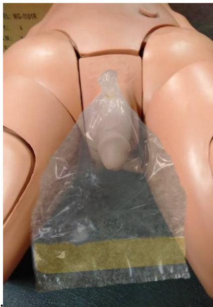
1.ผู้ช่วยพยาบาล