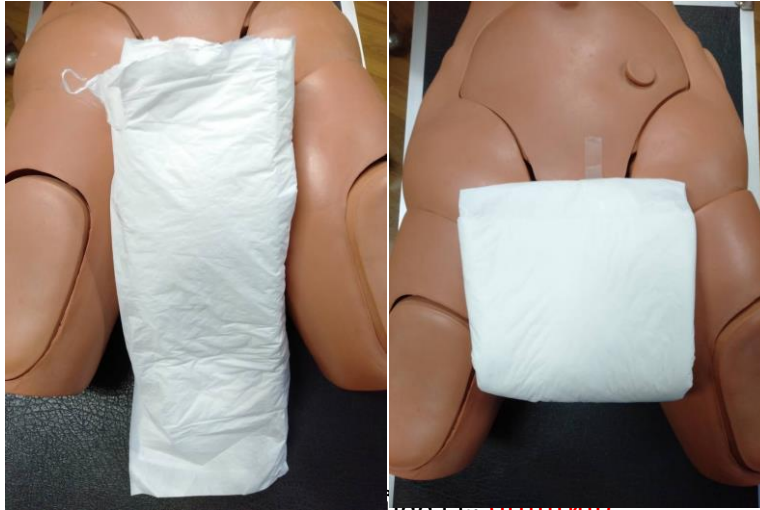
5. สุ่มแผ่นรองซัปปัสสาวะ (600x700 มม.)