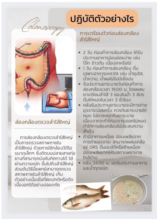
รูปภาพที่ 5