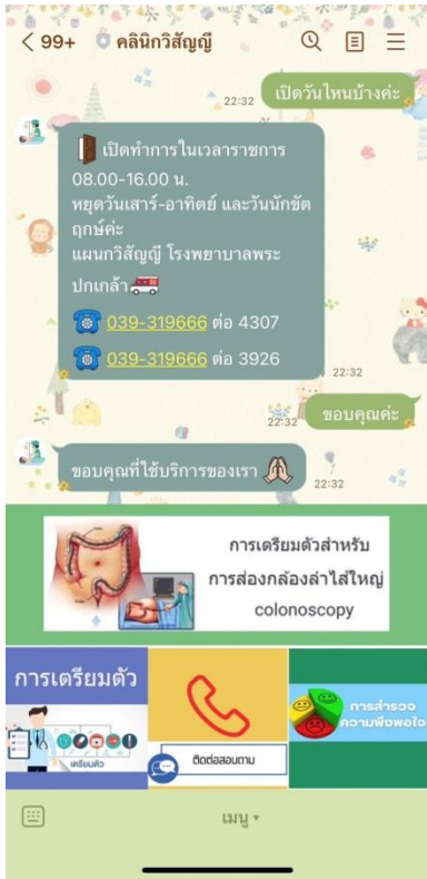
รูปภาพที่ 3