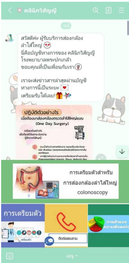
รูปภาพที่ 1