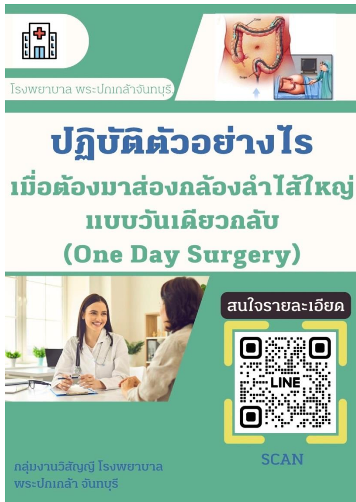
รูปภาพที่ 9 โปสเตอร์นำเสนอ QR Code พร้อมใช้งาน