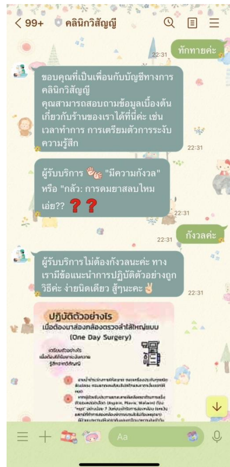
รูปภาพที่ 2