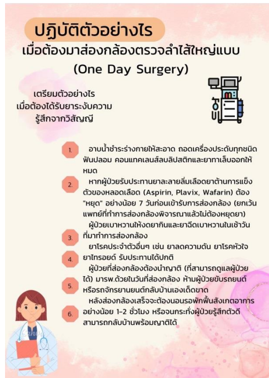
รูปภาพที่ 4