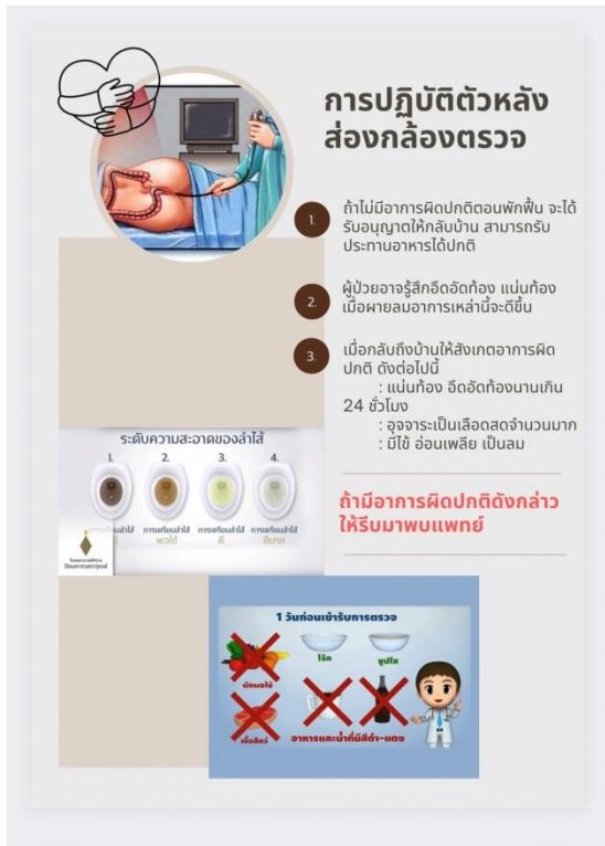
รูปภาพที่ 7