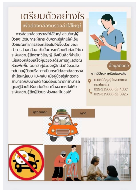
รูปภาพที่ 6