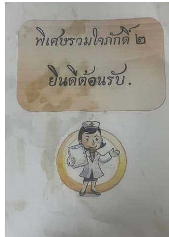
1.ภาพแฟ้มเอกสารแนะนำห้องพิเศษ (แบบเก่า)