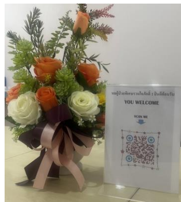
2.QR code แนะนำห้องพิเศษด้านในเป็นนวัตกรรมE-book (แบบใหม่)